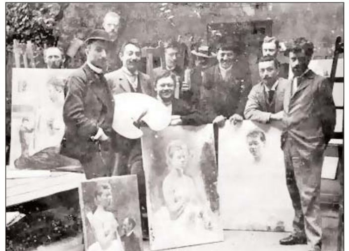
Hollósy és tanítványai 1896 körül

A természet a Zazar folyócska ölében a föld termékeny méhében fogant szerelmi nászából vajudta ki magából azt a varázslatos szépséget és harmóniát, amelyet a nagybányai