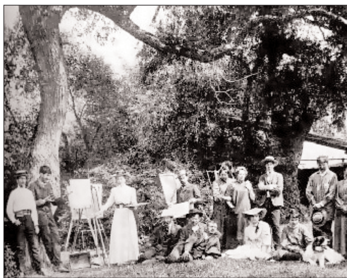
Hollósy és iskolája

Réthy István és Iványi Grünwald kiszakadtak Nagybányából. Egyedül Thorma maradt hű az őstalajhoz. Az ő művésze olyan természetű, mint a pálmác, amelynek vegetációja elsorvadna, alkotó tüze lelohadna, ha más égtájak földjébe ültetnék le kitépelt gyökereit.